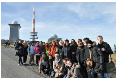
På udveksling i Aschersleben

Latin: Romerrigets sprog, ophav til alle romanske sprog. Grundmodel for sprogtilegnelse.