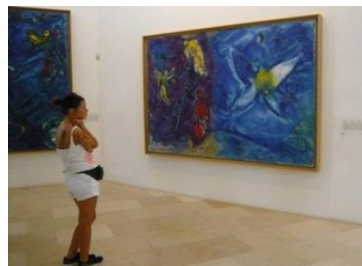
Chagall-museet i Nice

Please, bitte, por favor, s'il vous plaît, si placet! Bonjour, buenos días, guten Tag, hello, salve!