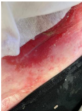
FØR OSTOFORM DAG 0